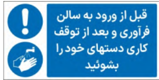
81133-Fa PVC ML LB PS BN 5×10 7×15 10×21 15×30 21×45 30×60