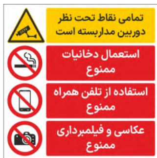
80102-Fa PVC ML LB PS BN 30×30 45×45 60×60