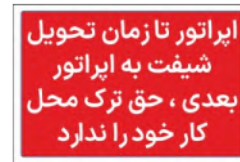
81170-Fa PVC ML LB PS BN 10×15 15×21 21×30 30×45 45×60 60×90