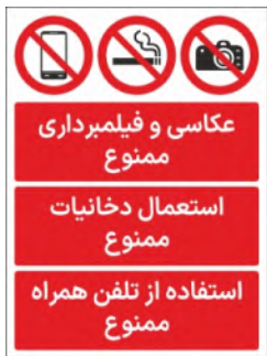
80050-Fa PVC ML LB PS BN 30×45 45×60 60×90