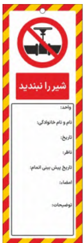
82136-Fa PVC ML 10×30 15×45