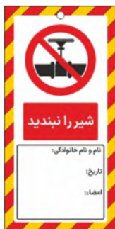
82137-Fa PVC ML 10×21 15×30