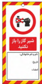
82131-Fa PVC ML 10×21 15×30