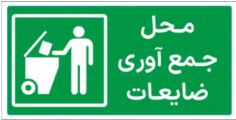
83120-Fa PVC ML LB PS BN 5×10 7×15 10×21 15×30 21×45 30×60