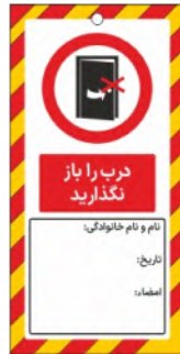
82146-Fa PVC ML 10×21 15×30