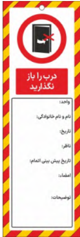
82145-Fa PVC ML 10×30 15×45