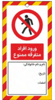
82148-Fa PVC ML 10×21 15×30