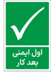
83040-Fa PVC ML LB PS BN 10×15 15×21 21×45 30×45 45×60 60×90