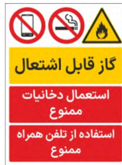
80021-Fa PVC ML LB PS BN 30×45 45×60 60×90