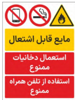
80020-Fa PVC ML LB PS BN 30×45 45×60 60×90