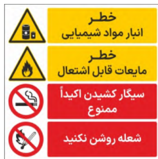
80103-Fa PVC ML LB PS BN 30×30 45×45 60×60