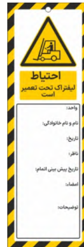
82110-Fa PVC ML 10×30 15×45