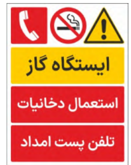
80030-Fa PVC ML LB PS BN 30×45 45×60 60×90