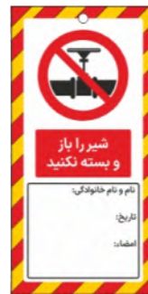
82133-Fa PVC ML 10×21 15×30