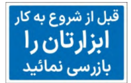
81193-Fa PVC ML LB PS BN 10×15 15×21 21×30 30×45 45×60 60×90