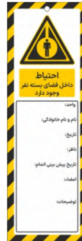
82104-Fa PVC ML 10×30 15×45