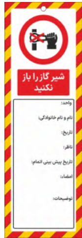
82130-Fa PVC ML 10×30 15×45