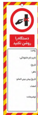
82141-Fa PVC ML 10×30 15×45