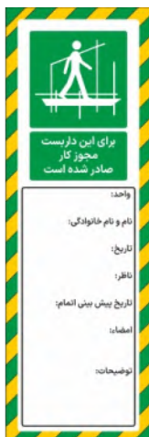
82171-Fa PVC ML 10×30 15×45