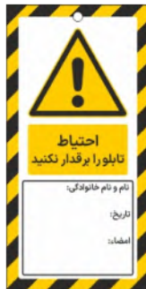
82107-Fa PVC ML 10×21 15×30