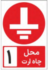
83050-Fa PVC ML LB PS BN 10×15 15×21 21×30 30×45 45×60 60×90