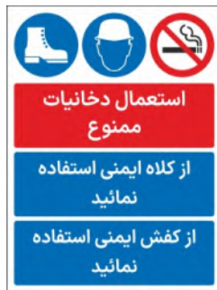
80065-Fa PVC ML LB PS BN 30×45 45×60 60×90