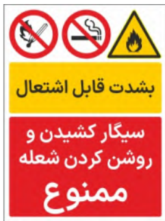
80006-Fa PVC ML LB PS BN 30×45 45×60 60×90