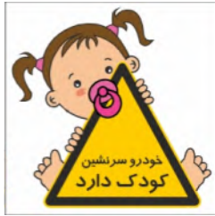
82091-Fa PVC ML LB PS BN 10×10 15×15 21×21 30×30 45×45 60×60