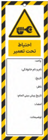
82100-Fa PVC ML 10×30 15×45