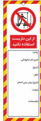
82155-Fa PVC ML 10×30 15×45