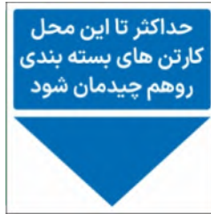
83170-Fa PVC ML LB PS BN 10×10 15×15 21×21 30×30 45×45 60×60