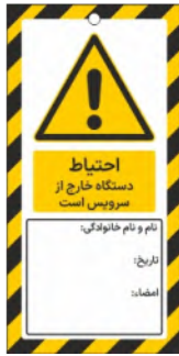
82113-Fa PVC ML 10×21 15×30