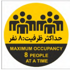
82061-Fa.En PVC ML LB PS BN 10×10 15×15 21×21 30×30 45×45 60×60