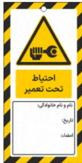
82101-Fa PVC ML 10×21 15×30