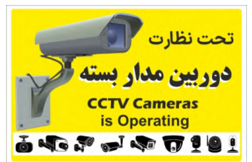
83100-Fa PVC ML LB PS BN 30×45 45×60 60×90