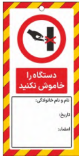
82144-Fa PVC ML 10×21 15×30