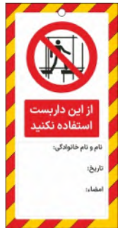
82156-Fa PVC ML 10×21 15×30