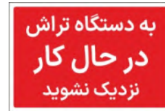
81175-Fa PVC ML LB PS BN 10×15 15×21 21×30 30×45 45×60 60×90