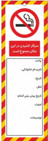
82149-Fa PVC ML 10×30 15×45