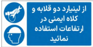
81136-Fa PVC ML LB PS BN 5×10 7×15 10×21 15×30 21×45 30×60