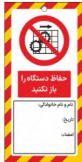
82154-Fa PVC ML 10×21 15×30