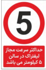
83001-Fa PVC ML LB PS BN 10×15 15×21 21×45 30×45 45×60 60×90