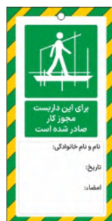
82172-Fa PVC ML 10×21 15×30