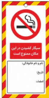
82150-Fa PVC ML 10×21 15×30