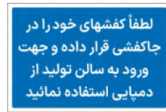
81191-Fa PVC ML LB PS BN 10×15 15×21 21×30 30×45 45×60 60×90