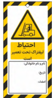
82111-Fa PVC ML 10×21 15×30