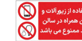
81145-Fa PVC ML LB PS BN 5×10 7×15 10×21 15×30 21×45 30×60