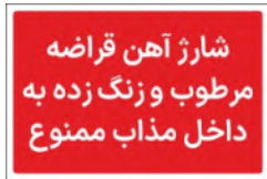
81172-Fa PVC ML LB PS BN 10×15 15×21 21×30 30×45 45×60 60×90