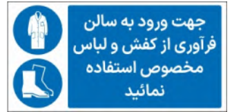
81131-Fa PVC ML LB PS BN 5×10 7×15 10×21 15×30 21×45 30×60