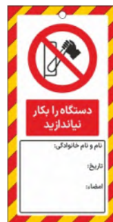
82140-Fa PVC ML 10×21 15×30