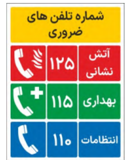
80091-Fa PVC ML LB PS BN 30×45 45×60 60×90