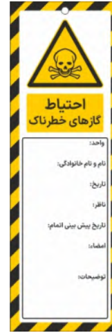
82116-Fa PVC ML 10×30 15×45