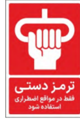
83030-Fa PVC ML LB PS BN 10×15 15×21 21×45 30×45 45×60 60×90