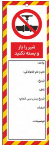
82132-Fa PVC ML 10×30 15×45