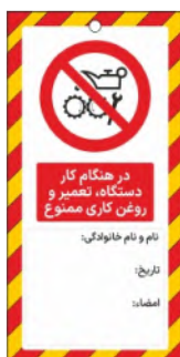
82158-Fa PVC ML 10×21 15×30