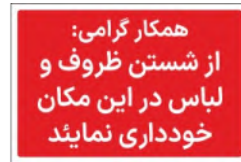
81174-Fa PVC ML LB PS BN 10×15 15×21 21×30 30×45 45×60 60×90