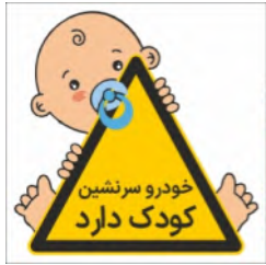
82090-Fa PVC ML LB PS BN 10×10 15×15 21×21 30×30 45×45 60×60