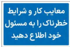
81190-Fa PVC ML LB PS BN 10×15 15×21 21×30 30×45 45×60 60×90