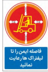
83020-Fa PVC ML LB PS BN 10×15 15×21 21×45 30×45 45×60 60×90