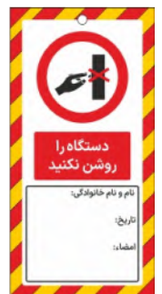
82142-Fa PVC ML 10×21 15×30