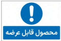
81160-Fa PVC ML LB PS BN 10×15 15×21 21×45 30×45 45×60 60×90