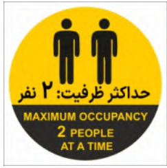
82060-Fa.En PVC ML LB PS BN 10×10 15×15 21×21 30×30 45×45 60×60