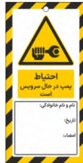
82103-Fa PVC ML 10×21 15×30