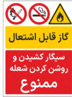
80003-Fa PVC ML LB PS BN 30×45 45×60 60×90