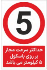
83000-Fa PVC ML LB PS BN 10×15 15×21 21×45 30×45 45×60 60×90