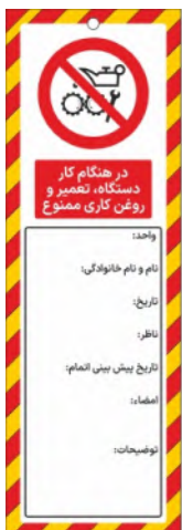
82157-Fa PVC ML 10×30 15×45