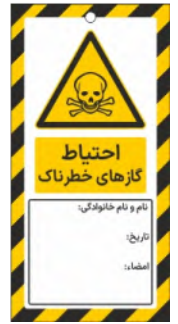
82117-Fa PVC ML 10×21 15×30