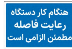
81192-Fa PVC ML LB PS BN 10×15 15×21 21×30 30×45 45×60 60×90