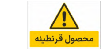
81150-Fa PVC ML LB PS BN 10×15 15×21 21×45 30×45 45×60 60×90