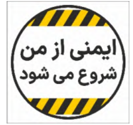
82067-Fa PVC ML LB PS BN 10×10 15×15 21×21 30×30 45×45 60×60