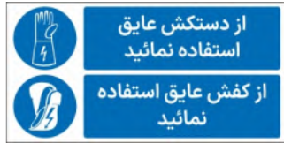
81112-Fa PVC ML LB PS BN 15×30 21×45 30×60