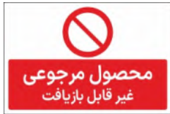
81155-Fa PVC ML LB PS BN 10×15 15×21 21×45 30×45 45×60 60×90