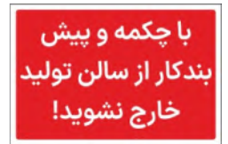
81171-Fa PVC ML LB PS BN 10×15 15×21 21×30 30×45 45×60 60×90