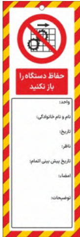
82153-Fa PVC ML 10×30 15×45