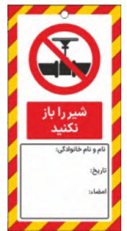
82135-Fa PVC ML 10×21 15×30