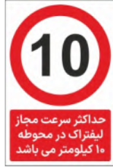
83002-Fa PVC ML LB PS BN 10×15 15×21 21×45 30×45 45×60 60×90