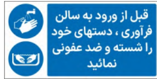
81134-Fa PVC ML LB PS BN 5×10 7×15 10×21 15×30 21×45 30×60