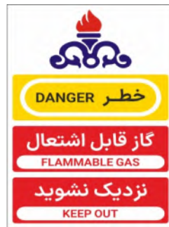
80090-Fa.En PVC ML LB PS BN 30×45 45×60 60×90