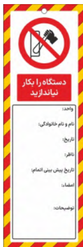
82139-Fa PVC ML 10×30 15×45