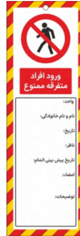
82147-Fa PVC ML 10×30 15×45