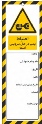
82102-Fa PVC ML 10×30 15×45