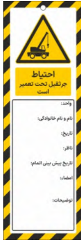
82114-Fa PVC ML 10×30 15×45