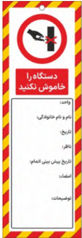
82143-Fa PVC ML 10×30 15×45