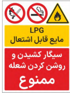
80002-Fa PVC ML LB PS BN 30×45 45×60 60×90