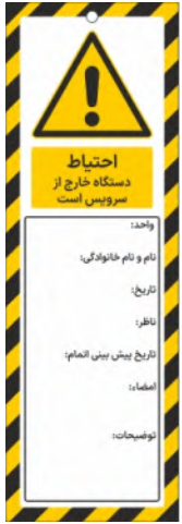
82112-Fa PVC ML 10×30 15×45