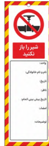
82134-Fa PVC ML 10×30 15×45