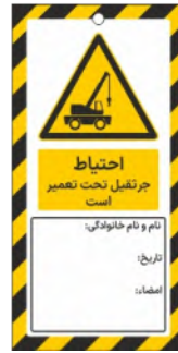
82115-Fa PVC ML 10×21 15×30