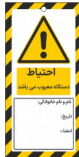
82109-Fa PVC ML 10×21 15×30