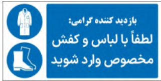
81132-Fa PVC ML LB PS BN 5×10 7×15 10×21 15×30 21×45 30×60