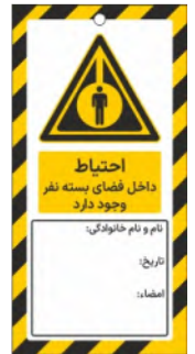
82105-Fa PVC ML 10×21 15×30