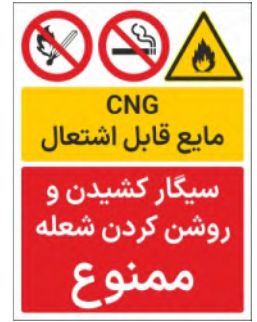
80004-Fa PVC ML LB PS BN 30×45 45×60 60×90