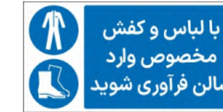
81137-Fa PVC ML LB PS BN 5×10 7×15 10×21 15×30 21×45 30×60