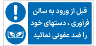
81135-Fa PVC ML LB PS BN 5×10 7×15 10×21 15×30 21×45 30×60