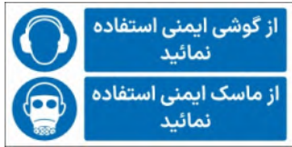
81111-Fa PVC ML LB PS BN 15×30 21×45 30×60