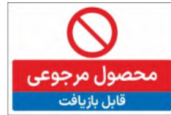
81165-Fa PVC ML LB PS BN 10×15 15×21 21×45 30×45 45×60 60×90