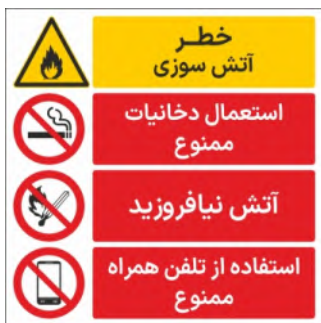
80100-Fa PVC ML LB PS BN 30×30 45×45 60×60