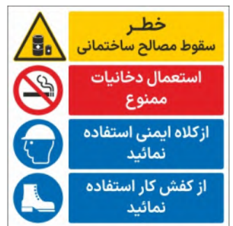
80104-Fa PVC ML LB PS BN 30×30 45×45 60×60